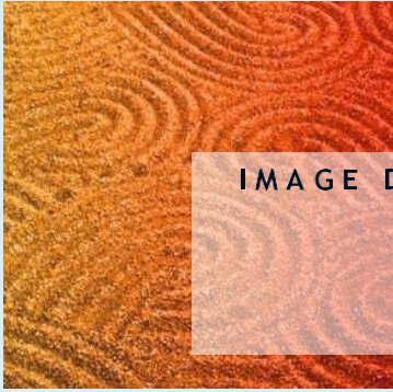
IMAGE DE SOI